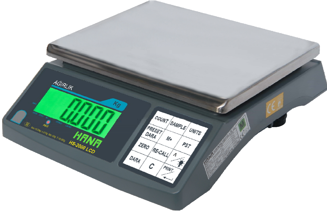
Çukur Kefe (Opsiyonel)