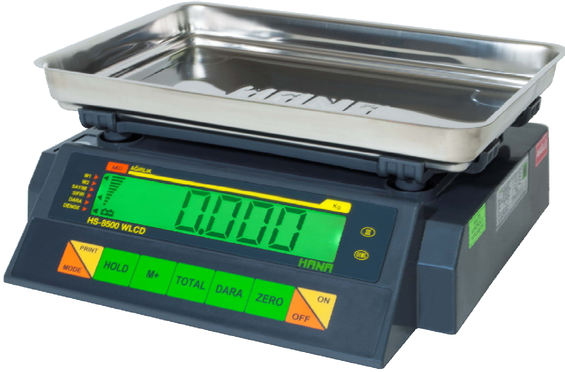
Plastik Çukur Kefeli (Opsiyonel)